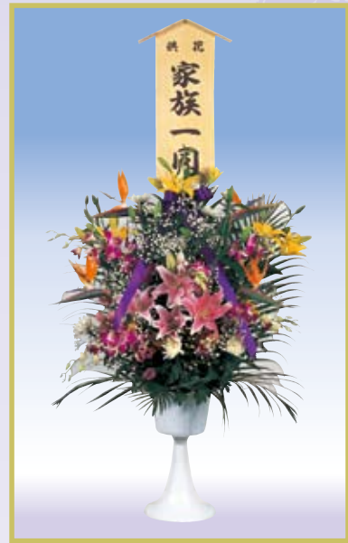
供花-20 20,000円(1対) (税込価格)